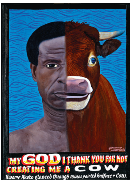
My God I thank you for not creating me a cow 2015-2016, Peinture glycérophtalique sur contreplaqué, 112.5 x 82 cm, Inv. 70.2017.14.3