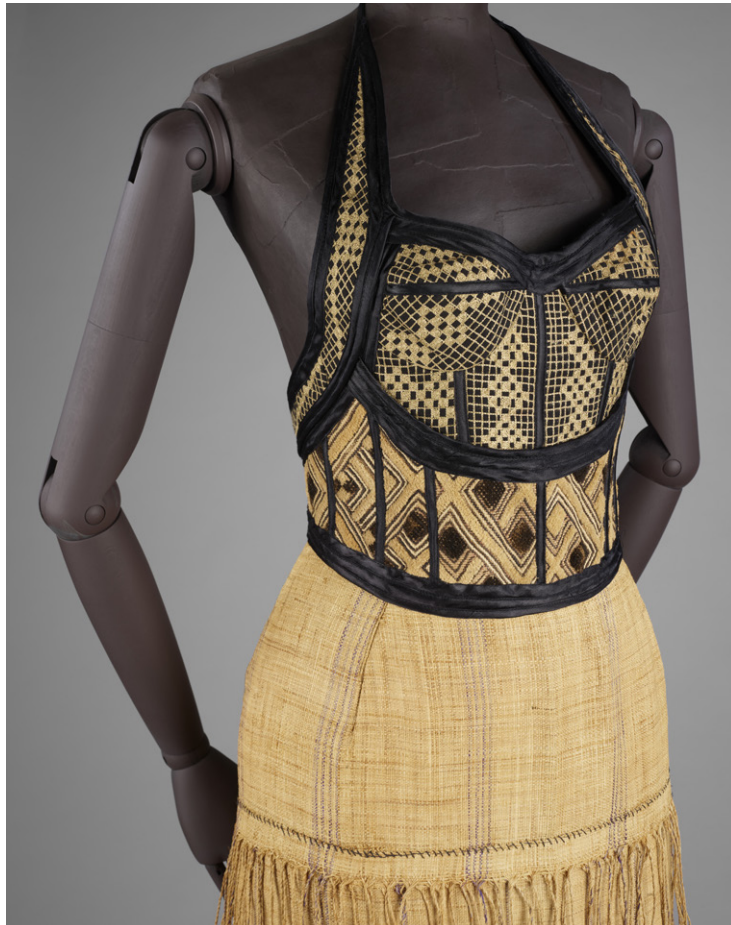
Alphadi (né en 1957, Malien) Bustier et jupe 1993, Niger, Tissu kuba (bustier) ; raffia tissé (jupe)