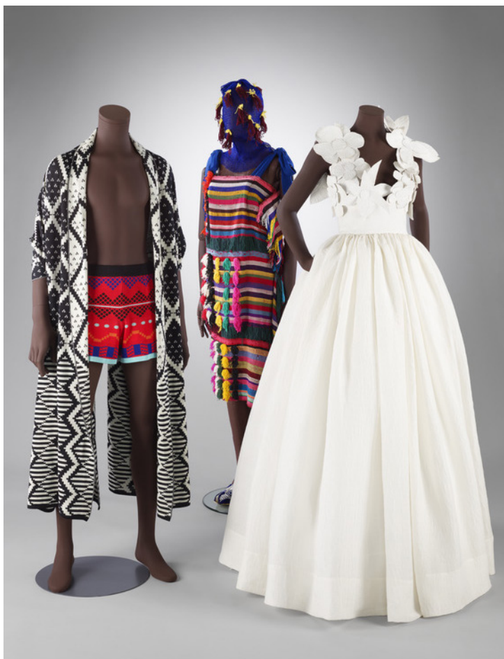
MAXHOSA AFRICA, IAMISIGO, Imane Ayissi

MAXHOSA AFRICA, une marque connue pour ses tricots à motifs géométriques de couleurs vives, véhicule une forte identité visuelle. Ses créations évoquent le perlage des Xhosas, peuple principalement issu de l'Afrique australe. Ladmua Ngxokolo, lui-