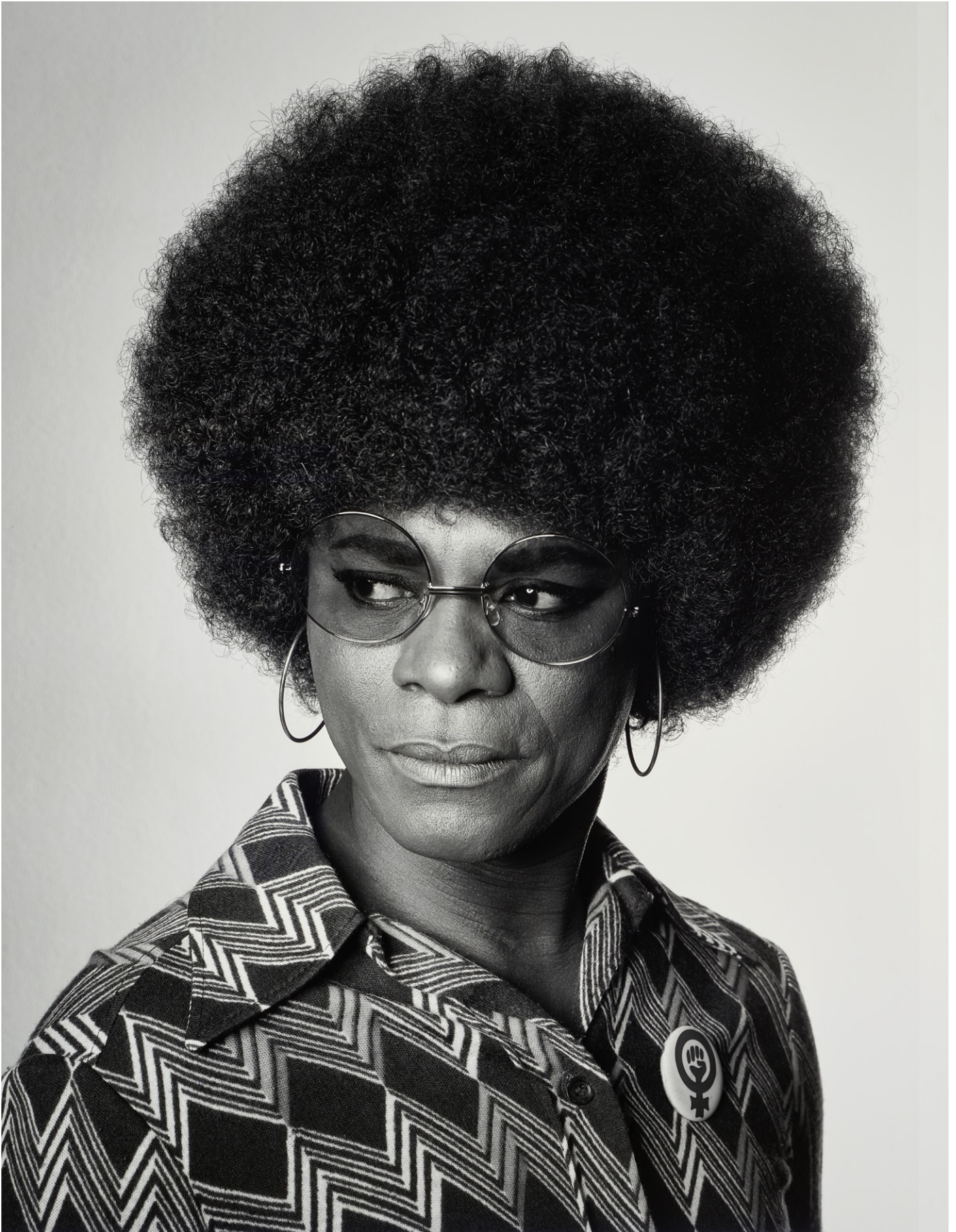
Samuel Fosso (né en 1962, Camerounais), African Spirits, République centrafricaine, 2008, Tirage argentique sur papier baryté Inv. 70.2010.7.4 a