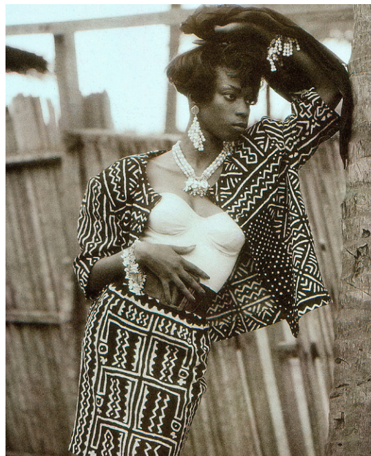
Création de Chris Seydou, Grand Bassam, Côte d'Ivoire, 1991