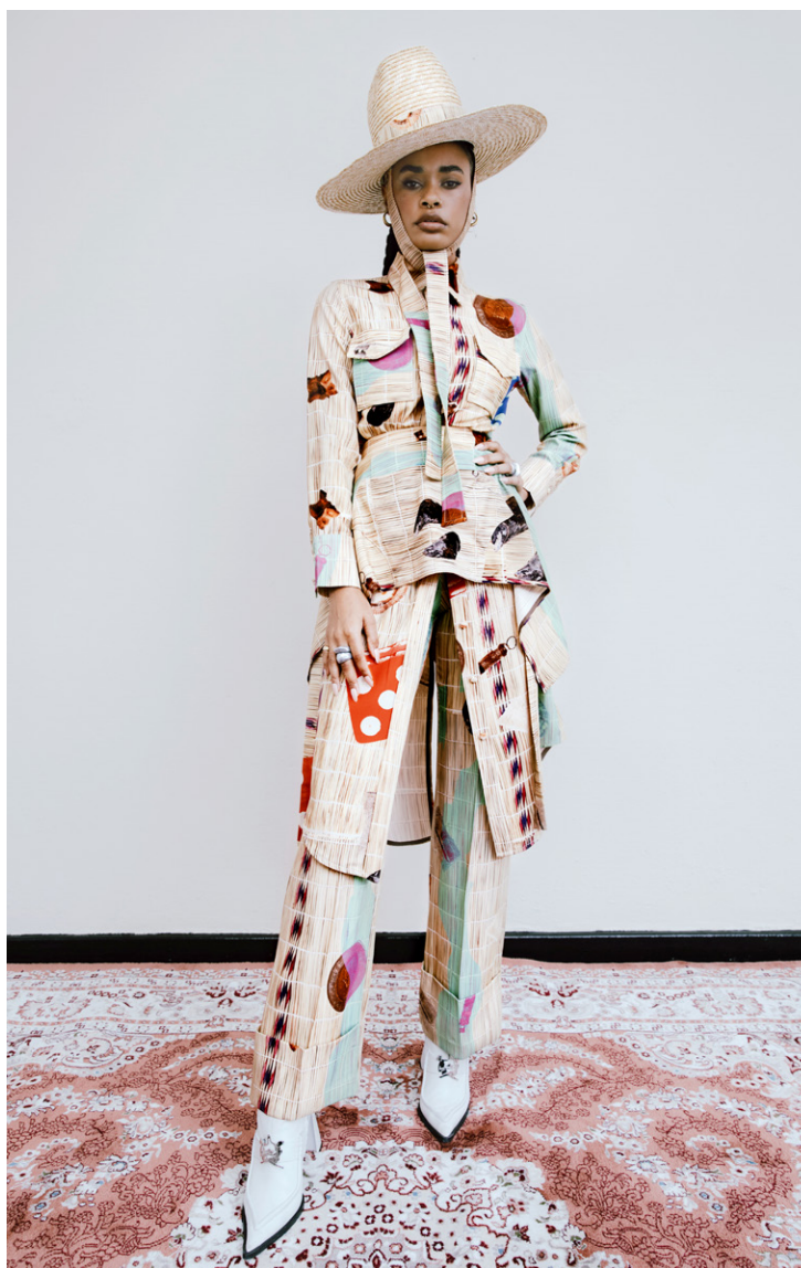
Thebe Magugu (né en 1993, Sud-Africain) Robe-chemise, pantalon, tablier, chapeau et chaussures, Collection Alchemy, Automne/Hiver 2021, Johannesburg, Afrique du Sud, Laine imprimée (robe-chemise, pantalon, tablier) ; paille (chapeau) ; cuir

La mode offre un espace pour l'imagination, l'espoir, le doute ou les aspirations. Des stylistes d'Afrique utilisent leur travail pour donner vie à un avenir plus équitable et durable, au profit de toute la population. Leurs pratiques reflètent et explorent le monde – passé, présent et futur – tout en faisant écho à un « afrofuturisme », qui insiste sur la représentation d'un monde meilleur pour les personnes noires. Loin de l'inertie ou de la nostalgie, ce courant narratif de la mode n'hésite pas à affronter les enjeux actuels, de la défense des droits LGBTQIA+ jusqu'à la lutte contre l'effacement du rôle des femmes noires dans l'histoire, en passant par la prise en charge de la crise environnementale. Ces stylistes traduisent leurs prises de position et leur côté provocateur à travers leurs coupes et patrons.