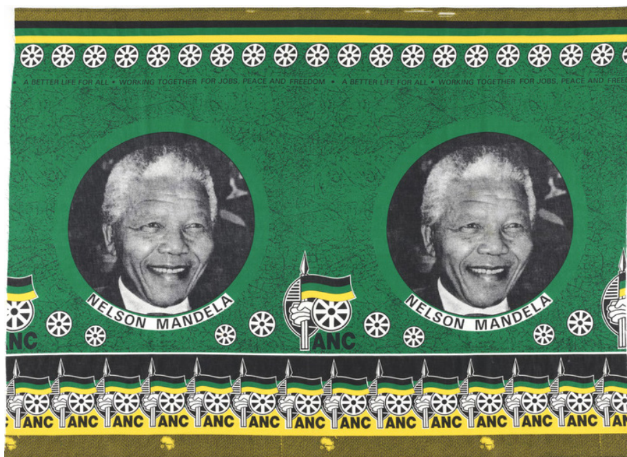
Tissu commémorant l'ANC (African National Congress) de Nelson Mandela Nkosi Traditional Fabrics CC (producteur), Début des années 1990, Akasia, Afrique du Sud. Coton imprimé

Au fur et à mesure que les nations africaines accèdent à l'indépendance, des tissus commémoratifs comportant des photographies de têtes dirigeantes et des messages de soutien ou de protestation sont produits. Commandés par des figures politiques dans un but de célébration ou de propagande, ces tissus sont fabriqués à peu de frais et accessibles à une vaste population. On les vend partout sur le continent et au sein de la diaspora. S'inscrivant dans une tradition bien établie, le port de ces imprimés commémoratifs devient un moyen manifeste d'afficher son identité, ses préoccupations ou ses idéaux.