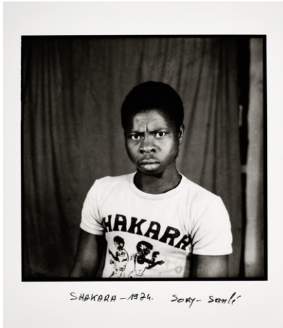
Sanlé Sory (né en 1943, Burkinabé), Shakara, 1974 : date de prise de vue / 2015 : date du tirage, Burkina Faso, Tirages argentiques sur papier baryté, vers 2010, Inv. 70.2017.28.20