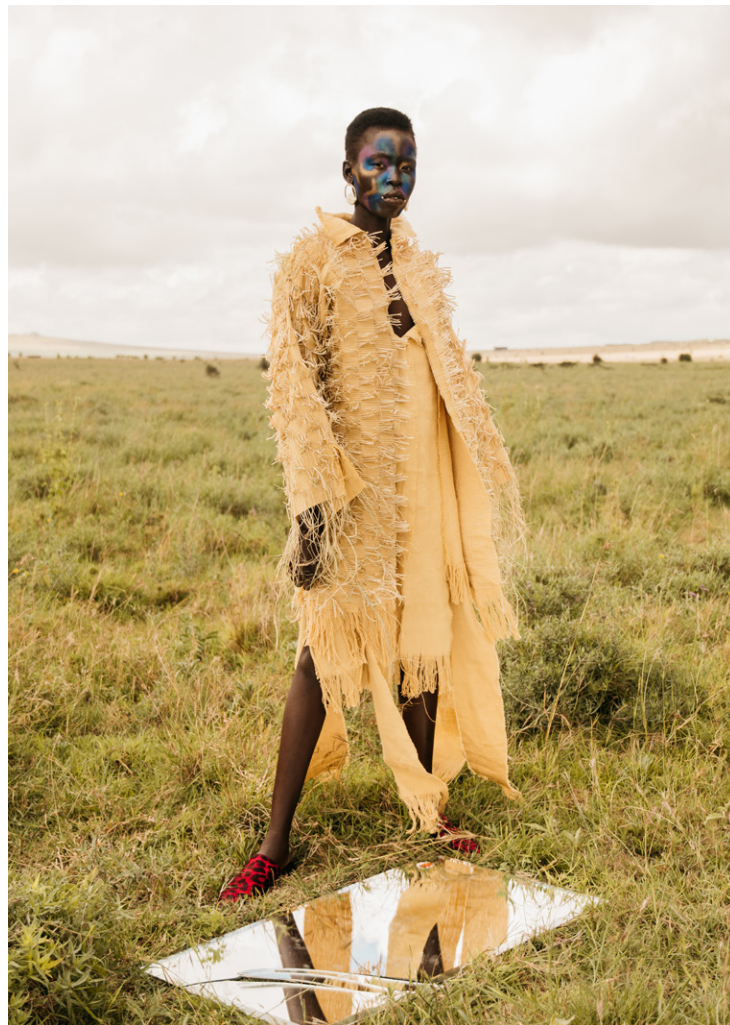
IAMISIGO - Bubu Ogisi (née au Nigériane) Veste, robe et chaussures. Collection Chasing Evil, Automne/Hiver 2020, Nairobi, Kenya (fabrication), Raphia de feuilles de palmier et coton mélangé (veste) ; coton tissé à la main (robe) ; fausse fourrure et cuir végétalien (chaussures) © Victoria & Albert Museum, Londres

Les mélanges inédits et ludiques de tissus occupent une place importante sur la scène de la mode africaine. En combinant les motifs, les textures et les imprimés, les stylistes créent un nouveau langage visuel qui évoque le passé tout en parlant de l'avenir. Pour beaucoup de créatrices et de créateurs, ce n'est pas seulement une question d'esthétique, mais de fusion intentionnelle de différentes références et traditions culturelles, qu'il s'agisse d'adapter le perlage xhosa à des tricots ou de transformer une babouche marocaine en chaussure de sport. Ces combinaisons incarnent souvent une vision panafricaine qui célèbre l'unité du continent tout en reconnaissant sa diversité. Elles évoquent aussi l'aspect mondial de la mode, en associant les créations africaines à ces nombreux échanges.