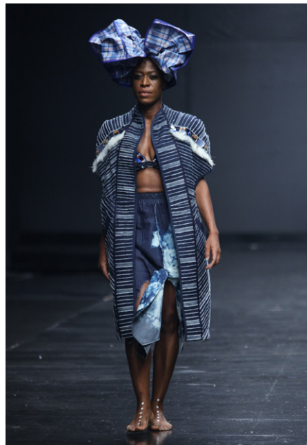
Nkwo Onwuka Veste, jupe, soutien-gorge, gèlè et chaussures Collection WHO KNEW, Printemps/Été 2019 Abuja, Nigeria, Denim, lin, verre, plastique (veste et soutien-gorge) ; denim blanchi (jupe) ; plastique (gèlè) ; plastique (chaussures) © Victoria & Albert Museum, Londres

L'Afrique valorise le savoir-faire artisanal, et tout ce qui est fabriqué, tissé ou brodé à la main y tient une place centrale. Ici, les techniques contemporaines côtoient les savoir-faire anciens, et le prêt-à-porter tutoie la haute couture. Les fibres et les tissus sont les points de départ de nombreux créateurs, et des textiles comme l' àdire , l' aşo-òkè ou le mohair sont de riches sources d'inspiration. La durabilité et les pratiques écologiques sont pour beaucoup une seconde nature : réutilisation, approvisionnement local et production circulaire sont des techniques implantées depuis longtemps sur le continent africain. La communauté y est aussi fondamentale. On estime que l'industrie de la mode africaine se chiffre à 31 milliards de dollars américains, un montant que les créatrices et créateurs contemporains souhaitent voir réinvesti à l'échelle locale, au profit des collectivités.