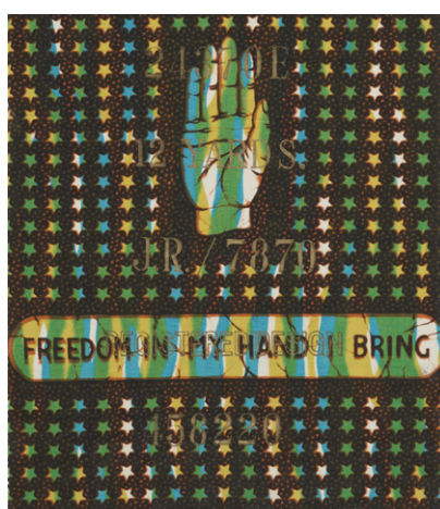
Échantillon de tissu Freedom in My Hand I Bring [J'apporte la liberté dans ma main] , A.G. Leventis & Co. Ltd (producteur), Vers 1960, Manchester, Royaume-Uni, Coton imprimé par réserve de résine