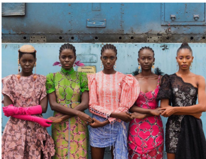
Models holding hands, Lagos, Nigeria, 2019 by Stephen Tayo. Courtesy Lagos Fashion Week

L'exposition est aussi l'occasion pour le musée du quai Branly – Jacques Chirac de mettre en lumière sa riche collection de textiles, accessoires et bijoux africains, ainsi qu'une sélection de photographies issues de ses archives et collectées auprès du public.