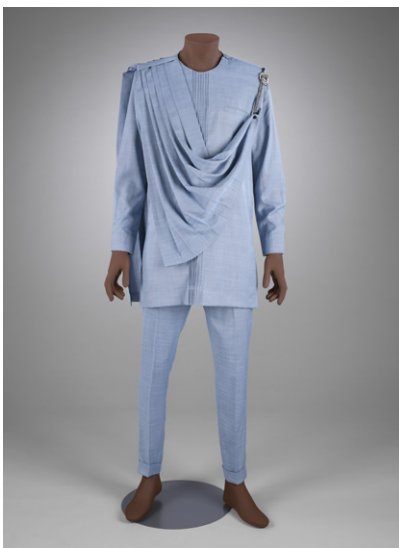
Moshions Haut et pantalon, Collection Intsinzi, Printemps/ Été 2018, Kigali, Rwanda, Mélange de laine et de viscose, perles de verre